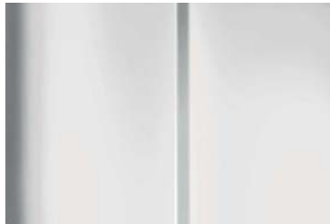
Weiss Banquise (P0WP)